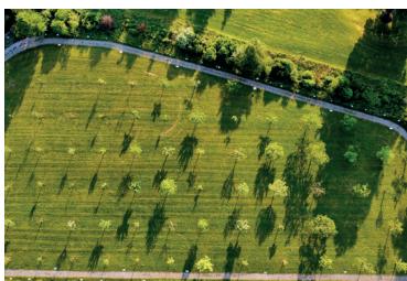
Drohnenbild Obstgarten Hemberg